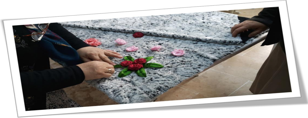
Yaygın Eğitim Dikiş Nakış Kursu