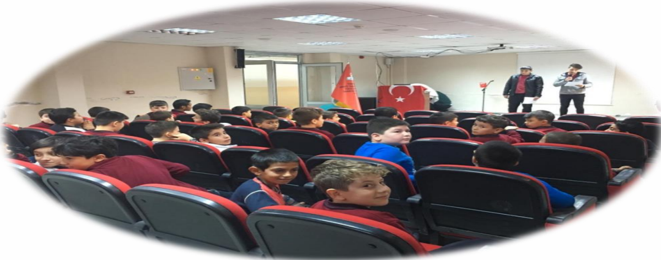
Mevlid-i Nebi Programı